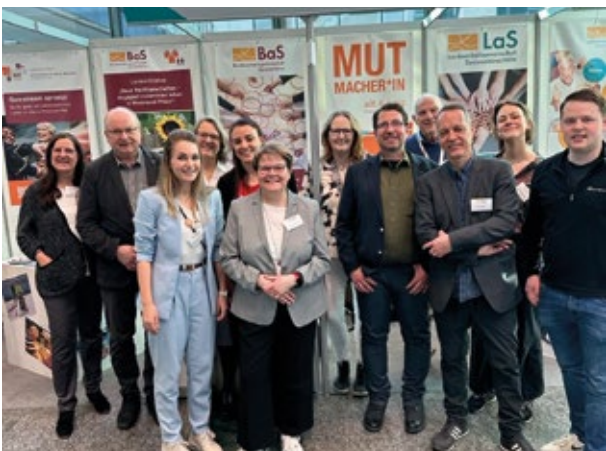
▲ 14. Deutscher Seniorentag: BaS-Stand mit Vorstand, Team und LaS-NRW