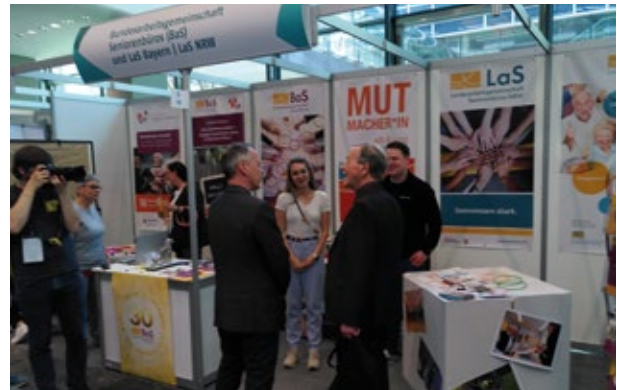
▲ 14. Deutscher Seniorentag: BaS-Stand mit Vizekanzler, Minister und BAGSO-Vorsitzendem a. D. Franz Müntefering