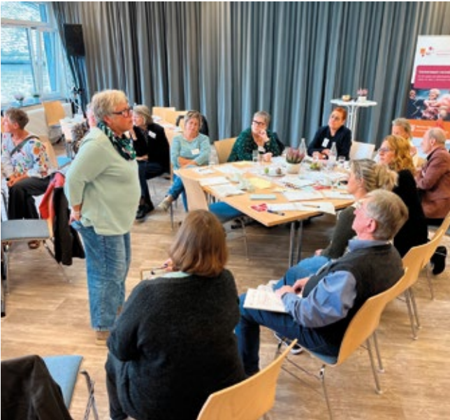
▲ LNW RLP: Workshopsituation beim Jahrestreffen des Landesnetzwerks