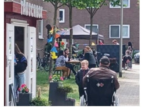
▲ Fest der Nachbarn an der Tauschbox Bocholt