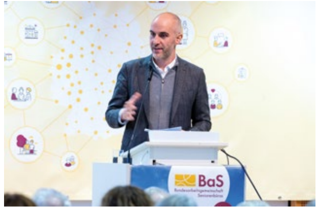
⤴ Begrüßung des Oberbürgermeisters der Landeshauptstadt Hannover Belit Onay