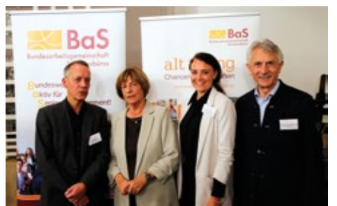
▲ v. links oben n. rechts unten: Berlin-Fahrt 2025 (Bild 1–4), Projekttreffen 2025 in Aachen (Bild 5–12)