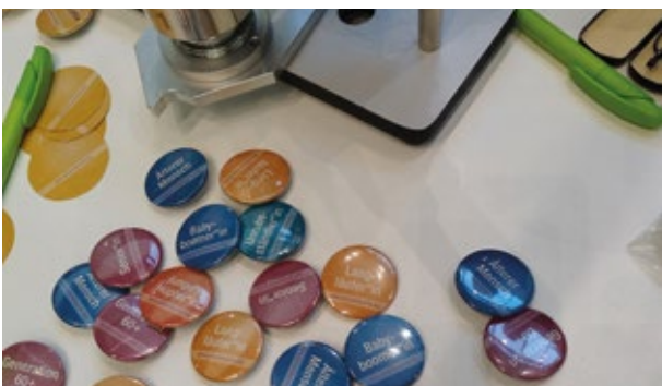
▲ 14. Deutscher Seniorentag: Buttons für Besucher:innen