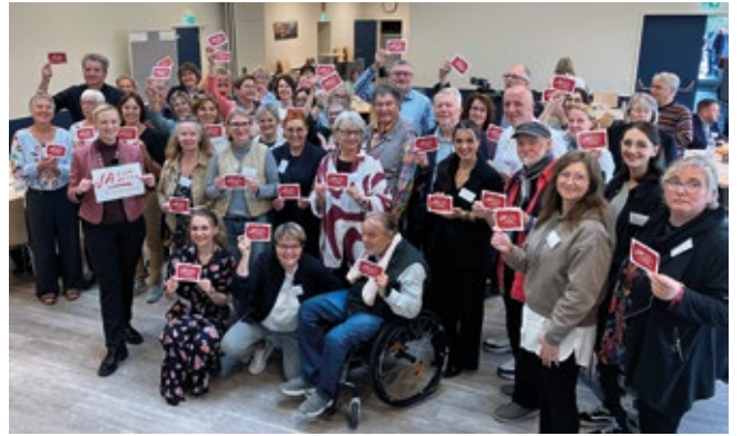
▲ LNW RLP: Gruppenbild Ja zum Alter beim Landesnetzwerktreffen mit Ministerin Dörte Schall