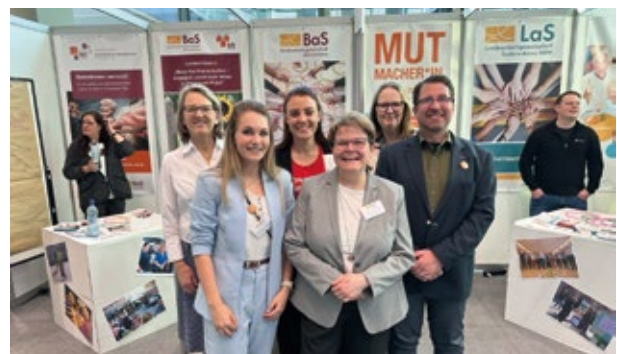
▲ 14. Deutscher Seniorentag: BaS-Stand mit Team der Geschäftsstelle