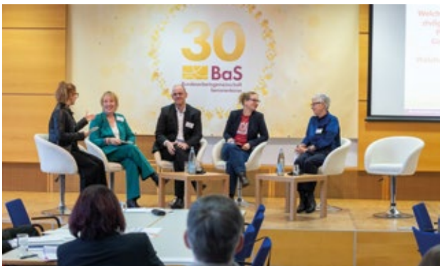
⤴ Perspektiven Gespräch: „Konflikt oder Kooperation? Generationendialog in Zeiten des Umbruchs“