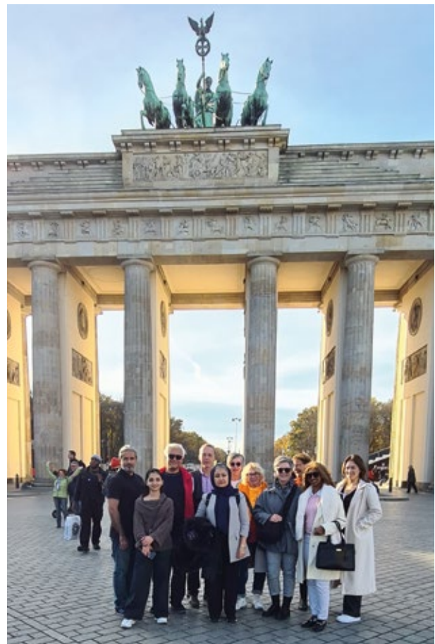
▲ Berlin-Fahrt 2025