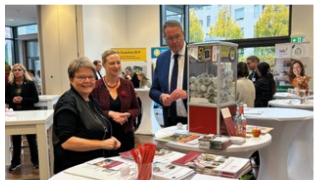
▲ LiNN: BaS-Referentin Annette Scholl zeigt auf dem Sozialkongress Ministerpräsident Alexander Schweitzer und Ministerin Dörte Schall den Automaten mit Informationen zur Landesinitiative Neue Nachbarschaften RLP