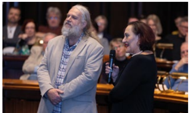
⤴ Erinnerungen an 30 Jahre BaS im Ratssaal des neuen Rathaus in Hannover