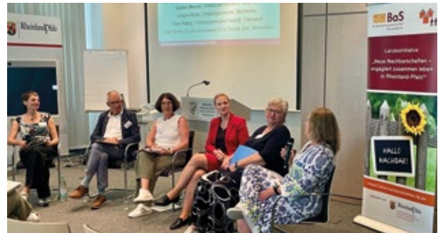
▲ LiNN: Austausch mit Ministerin Dörte Schall bei einer Podiumsdiskussion