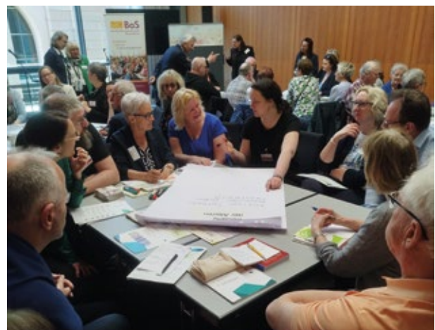
▲ 14. Deutscher Seniorentag: Tischgruppen beim BaS-Workshop „Erfolgsmodell Seniorenbüro“