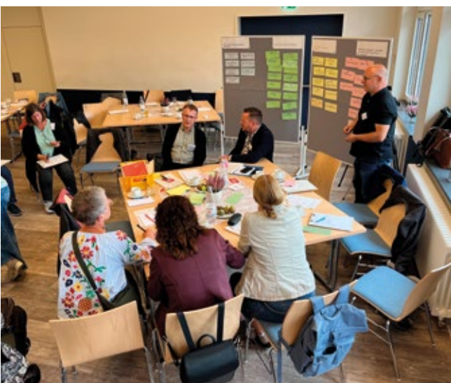
▲ LNW RLP: Workshopsituation beim Jahrestreffen des Landesnetzwerks