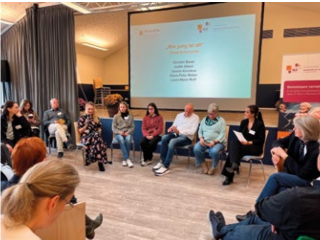
▲ LNW RLP: Gesprächsrunde „Wie jung ist alt?“ mit zwei Schülerinnen aus Montabaur