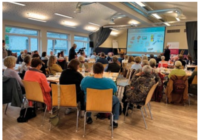
▲ LNW RLP: gefüllter Raum mit Teilnehmenden