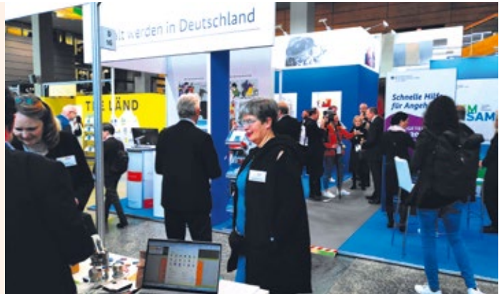
▲ DST: Blick vom BaS-Stand auf den badenwürttembergischen Stand „The Länd“

Die Kontakte zu Seniorenbüros in Baden-Württemberg konnten auf dem Deutschen Seniorentag in Mannheim vertieft werden. Zudem steht die BaS seitdem im Austausch mit dem Ministerium für Soziales, Gesundheit und Integration Baden-Württemberg.