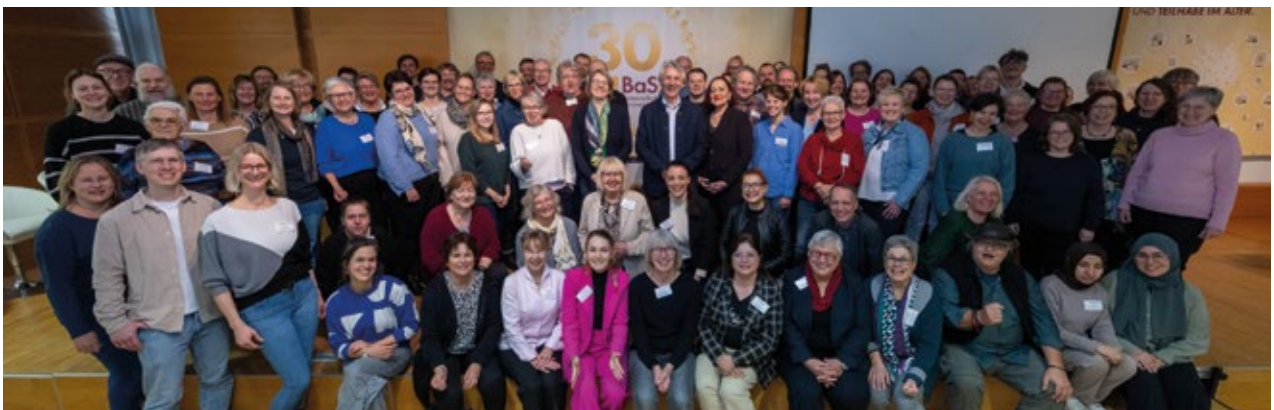
⤴ Teilnehmende und Mitwirkende an der Fachtagung in Hannover